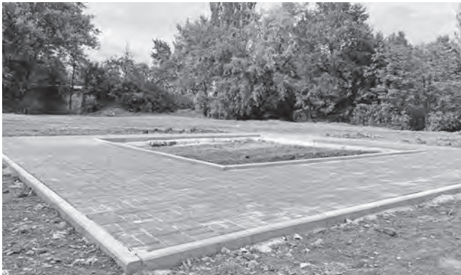
Начало работ по созданию «Экопространства»

В системе государственных закупок «Прозорро» городского управления коммунального хозяйства проведено тендер на приобретение оборудования для детской игровой площадки.