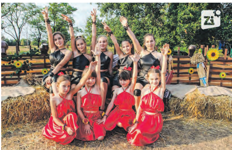
Ко Дню 30-летия независимости Украины в Константиновской громаде состоялся фестиваль украинской культуры.

Мероприятие такого формата, как и место проведения, стали новшеством для громады. Впервые локацией для массовых гуляний была определена территория возле стадиона «Рекорд».