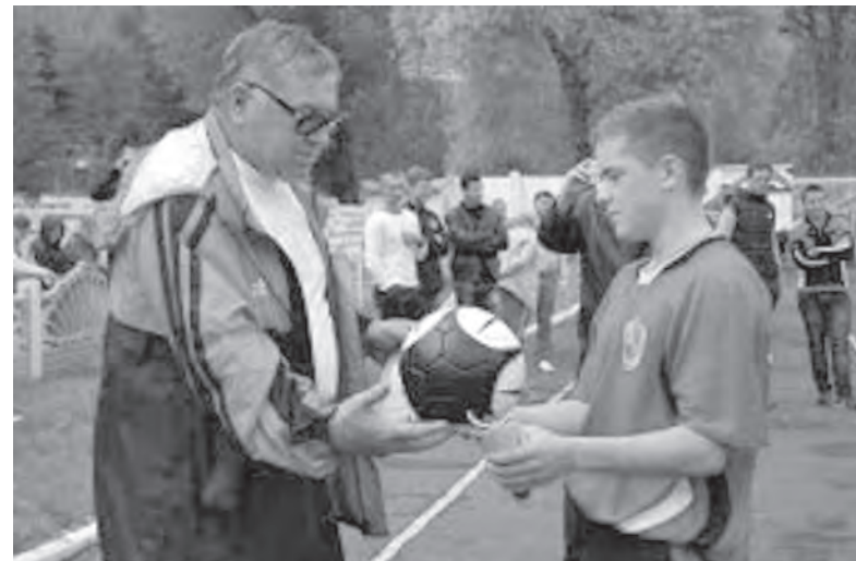
Земцов был организатором многих соревнований

Победителями турнира стали краматорчане, обыгравшие покровчан в финале со счетом 2:1. Поединок за третье место между константиновцами и добропольчанами завершился вничью 2:2, а все серии пенальти удачливее оказались гости.