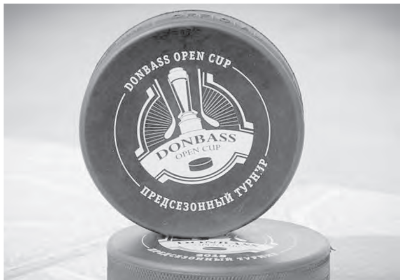
Официальная шайба турнира в Дружковке

Последним победителем Открытого кубка Кременчуга среди профессиональных команд, который состоялся в 2016 году, стал «Кременчуг». В 2017 году турнир не проводился из-за реконструкции «Айсберга», а в 2018 году он был разыгран среди детских команд.