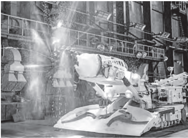
«Корум Дружковский машиностроительный завод» изготовил комбайн КПД №100.

Впервые проходческий комбайн легкого типа КПД представили заказчиком на «Горловском машиностроительном заводе» 7 февраля 2002 года. Вскоре приступили к серийному выпуску.