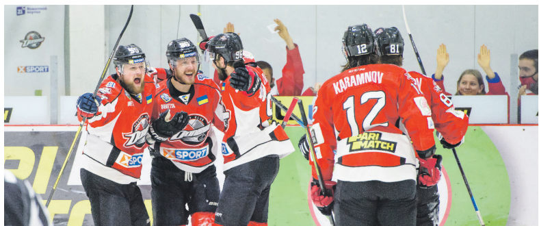
Стартовые матчи прошли на дружковской арене «Аль-таир».

В пятницу, 16-го апреля, состоялся первый матч финала плей-офф пятого сезона Украинской хоккейной лиги. Борьбу за титул в серии до четырех побед на льду дружковской арены «Альтаир» начали донецкий «Донбасс» и киевский «Сокол».