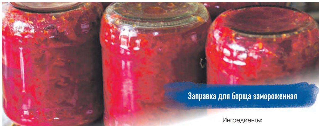
Заправка для борща замороженная