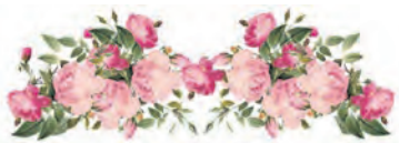
Михайло МИЛИЙ ТВІЙ ПОГЛЯД

За пять минут до рассвета Июль поступал в окошко, Оставив для нас на крылечке Полное ягод лукошко. Крыжовник, малина, черника И солнечный абрикос, А рядом прохладой дышащий Букет нежно-белых роз.