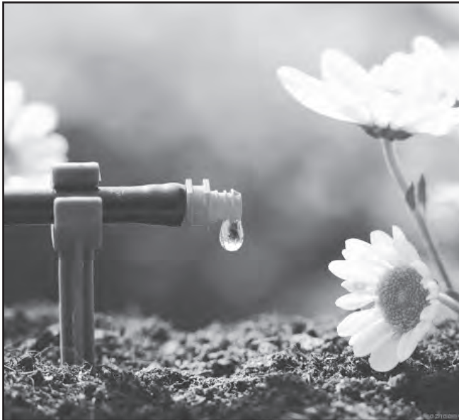
Полив разбрызгиванием (дождеванием) эффективнее. Для него кроме шланга нужны так называемые разбрызгиватели. Они могут быть примитивными (типа улитки) и импульсными (фрегат). Также на смену хомутам пришли коннекторы для

Установившаяся сейчас дождливая погода обеспечит прекрасный старт высаженной рассаде и посевам. Но я уверен, лето не будет таким же благоприятным для овощеводства. Нас ожидают высокие температуры и нерегулярные осадки. Существует закономерность в виде среднегодовой нормы осадков: после обильных дождей приходит засуха. Наша задача обеспечить растениям качественный регулярный полив. Без него овощи не в состоянии нормально развиваться и дать хороший урожай. Затраты на качественные семена, рассаду и пр. могут пойти насмарку. Какой способ полива выбрать? Старый и трудоёмкий - полив под корень. Для него используются вёдра, лейки, либо шланг. Наряду с надёжностью и простотой, он отнимает очень много времени и сил. Неоправданно большой расход воды, необходимость последующего рыхления почвы делают этот способ встречающимся всё реже.